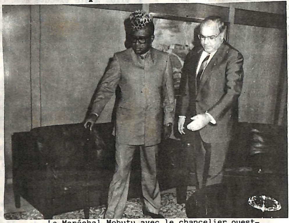
Le Maréchal Mobutu avec le chancelier ouest-allemand Helmut Kohl

notre correspondant à Bonn comparaison de l'endettement total du monde qui s'élève à environ 970 milliards de dollars, ne dépassant pas 80 milliards pour l'ensemble des pays d'Afrique sub-saharienne. Cette dernière est considérée comme une charge modeste. Cependant, la valeur absolue ne représente pas moins une menace pour le continent noir, du fait du bon nombre de pays endettés, le taux d'endettement (dette